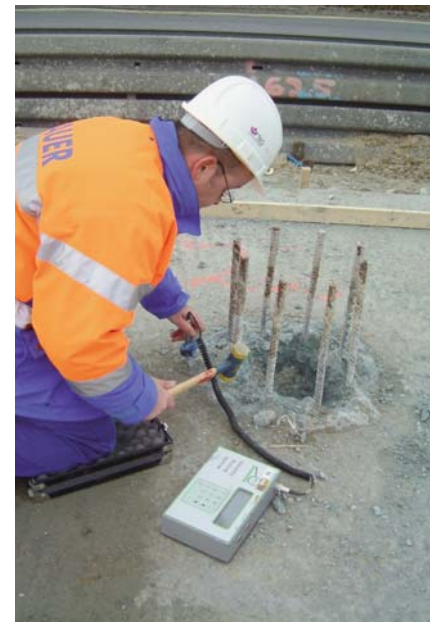
Bautechnik-Mitarbeiter beim Ausführen von IT-Tests

Der optimale Anwendungsbereich der Methode umfasst Ortbetonpfähle in nichtbindigen Böden mit einem Verhältnis von Durchmesser zu Länge nicht größer als 1:30.