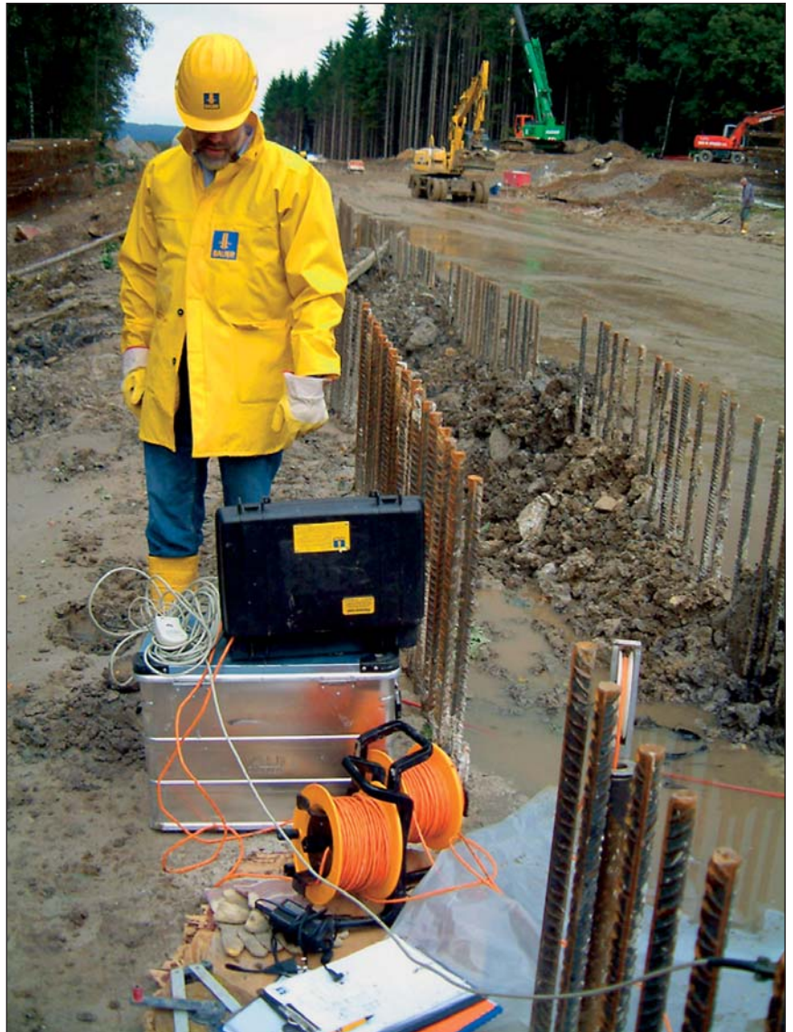
Belgien, Eupen: Cross Hole Ultrasonic Messung - durchgeführt von Bauer Spezialtiefbau

Diese Ausbreitungsgeschwindigkeit hängt im Wesentlichen vom Schubmodul des Betons und damit von der Qualität des Betons ab.