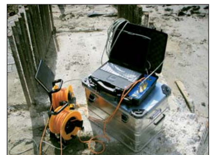
Aufgebautes Cross Hole Ultrasonic Messgerät CHUM Messeinheit ( www.Piletest.com )

Ähnlich verhält es sich mit der Dämpfung bzw. der Impedanz des Schallsignals.